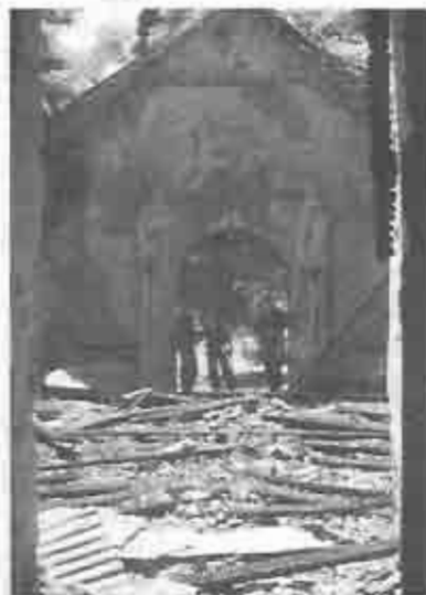
Fotos del daño causado por el incendio