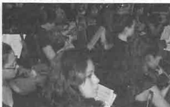
La Orquesta Infantil y juvenil de Villa Lengua