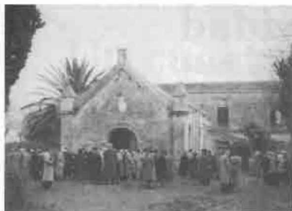
Culto Clausura 1953