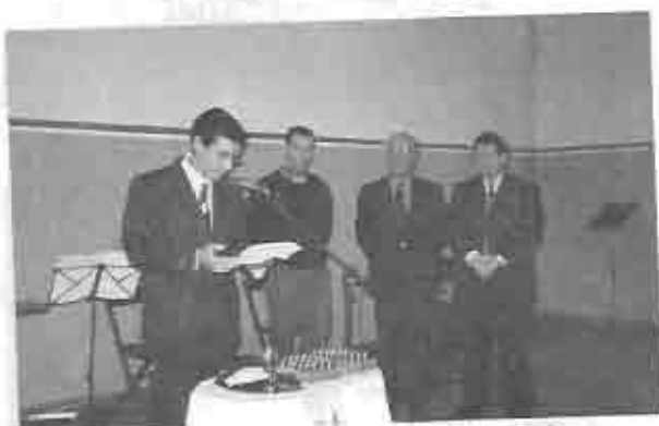
Ceremonia de inauguración de la iglesia