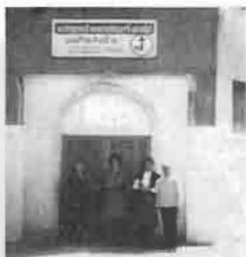
Nace la Iglesia