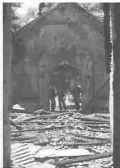
Fotos del daño causado por el incendio