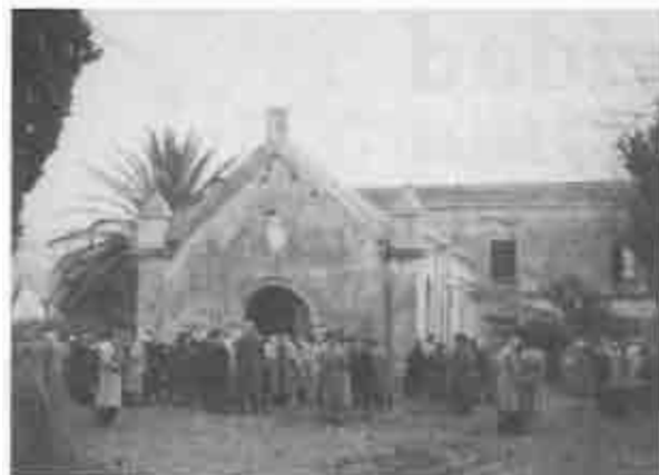
Culto Clausura 1953