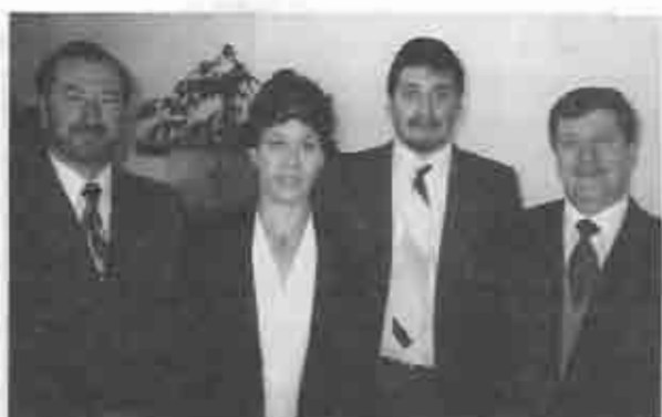
Primer consistorio 1997