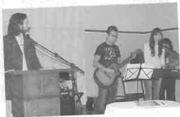
Pastor y músicos