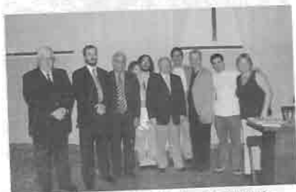
Representantes del Presbiterio en la ceremonia de la particularización de la iglesia