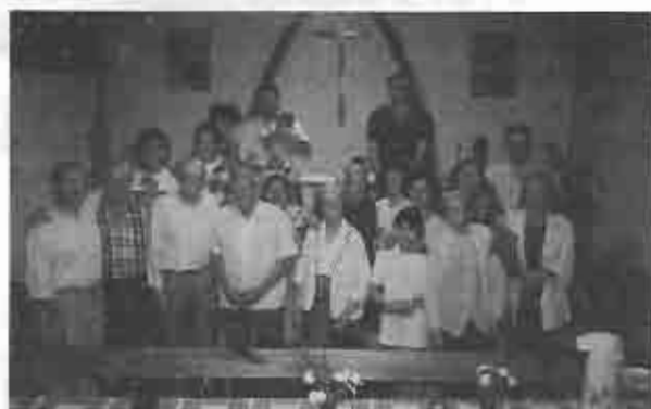
Culto año 1992