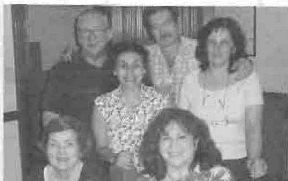
Grupo de estudios biblicos

Para su próxima visita a Buenos Aires no dude en comunicarse con nosotros, le brindaremos toda la información que usted necesite.