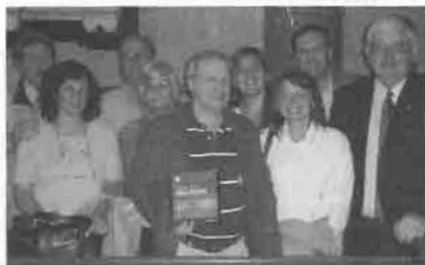
Representantes del Presbiterio en el concierto del 7 de diciembre