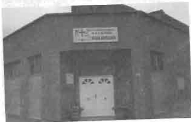
Nueva fachada de la Iglesia