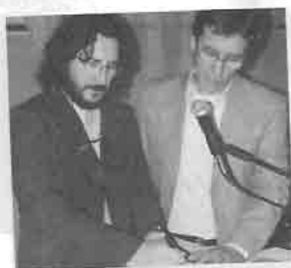
Firma del documento correspondiente a la particularización