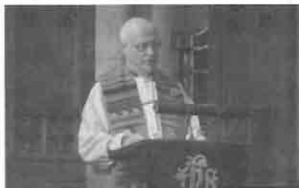
Obispo Anglicano Gregory Venables

En los cultos en castellano e inglés pudimos recordar el tradicional Día de San Andrés. Recordamos la historia detrás del nombre de nuestra iglesia, destacándose la actitud del apóstol Andrés en la evangelización por medio del testimonio personal, un verdadero imperativo para nuestro tiempo.