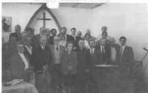
Celebración de los diez años del Presbiterio San Andrés 1997